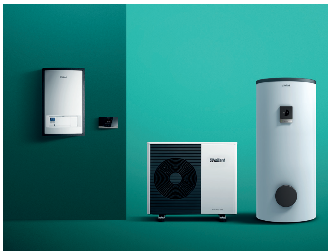
Tepelné čerpadlo aroTHERM plus, externý zásobník teplej vody uniSTOR, závesný hydraulický modul, systémový regulátor sensoCOMFORT