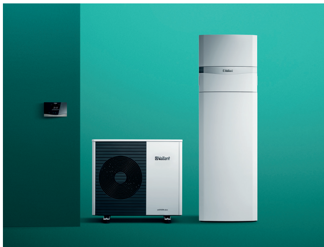
Tepelné čerpadlo aroTHERM plus, hydraulický modul uniTOWER plus s integrovaným zásobníkom TV, systémový regulátor sensoCOMFORT